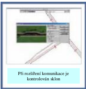
Při rozšíření komunikace je kontrolován sklon