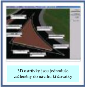
3D ostrůvky jsou jednoduše začleněny do návrhu křižovatky