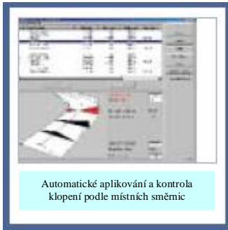
Automatické aplikování a kontrola klopení podle místních směrnic